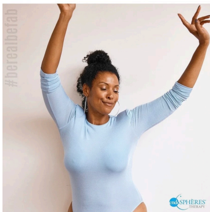
1/4 Endosphères be real, be fab

Fenty Beauty offre 50 sfumature di fondotinta, riuscendo a soddisfare tutte le esigenze, dalle pelli più chiare a quelle più scure.