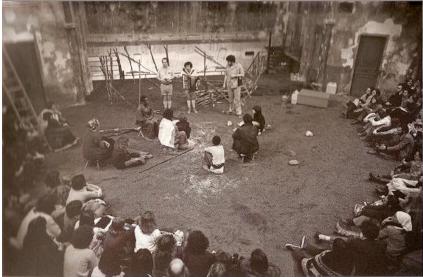
4 > Les Iks d'après The Mountain People de Colin Turnbull, mise en scène et scénographie de Peter Brook, théâtre des Bouffes du nord, Paris, 1975.